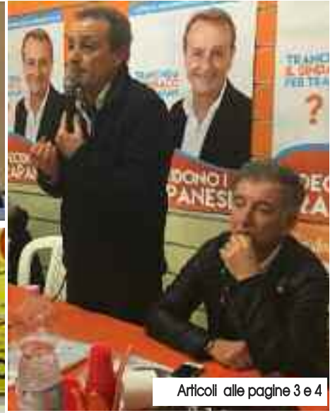
Articoli alle pagine 3 e 4